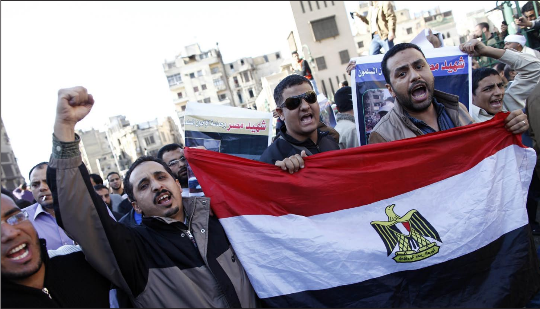
مئات اثناء تشيع احد قتلى الاشتباكات الاخيرة في القاهرة

وبعد، فإن إحصائياً وما يصحبها من تخبط في مؤسسة الرئاسة، هما سيدا الموقف، ما يفتح الباب على مصراعيه أمام مصادرات مجبولة، تنذر كلها بما هو أسوأ، ليس آخرها الانقسامات في السلك القضائي، وإذا أصرت جماعة الإخوان على مواعدها للاستفتاء على الدستور، الذي تصفه قوى المعارضة بالمعيب، فإن المزيد من الفوضى ستحكم الشارع المصري ومؤسسات الحكم، وسيتمتع الانقسام بين المصريين، الذين ما عرفوا يوماً غير وحدتهم كمواطنين، يؤمنون أن الدين لله والوطن للجميع، وهو عكس ما يسعى إليه الإخوان المسلمون.