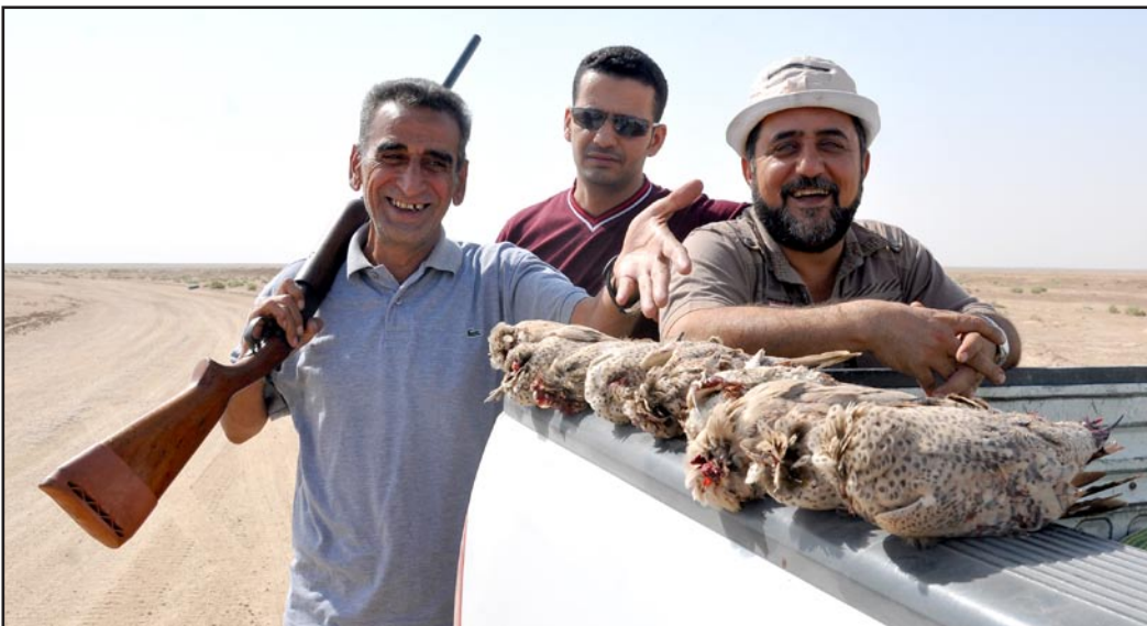
المرح مع الصيادين والضحايا

يقول رئيس جمعية الصيادين إن الصقور توصف كالجبال من خلال أفعالها، فلكل نوع خاص ميزة معينة وقابليات ينفرد بها صقر عن آخر، فقد تجد صقور تحظى بنسب التدريب والاهتمام والطعام ولكنها تختلف بأفعالها كما يقول الصياد، فهناك صقر من نفس النوع قد يصطاد ثلاث حباري في سويعات، وآخر من نفس النوع لا يستطيع صيد واحدة وقد يصل لها ويخاف منها ويعود خالي الوفاض.