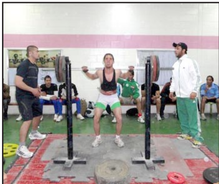
جانب من فعالية القوة البدنية