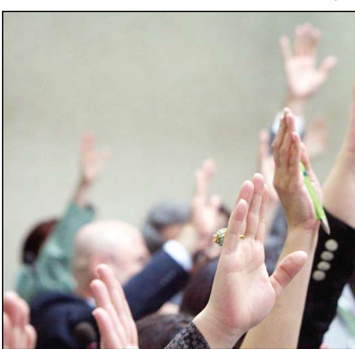
مجلس النواب... (أرشيف)

ويوضح "السلف جاءت نتيجة أعمال طارئة مثل الانفجارات التي طالت الكثير من المدن العراقية، حيث يتبرع مجلس الوزراء بمبالغ مالية أنت إلى تراكمها وهذا أمر طبيعي".