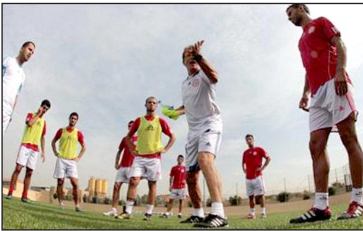
بيوكير ينهي استعداداته للبطولة