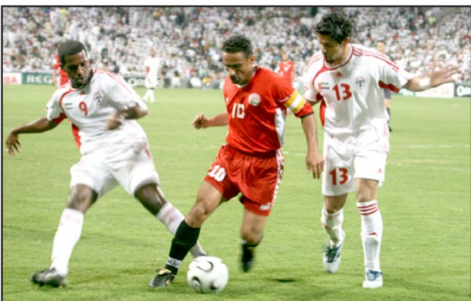
خليجي ٢١ يتربح انطلاقا في النامه