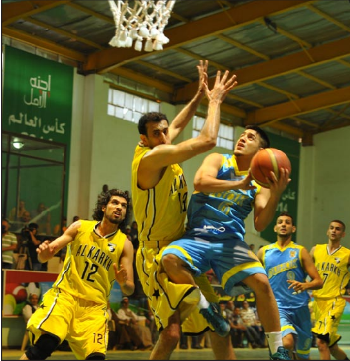
الكهرباء يطمح الى كسب جولته امام دهبوك

الكهرباء في اجتياز خصوم كبار . وكان فريق الشرطة قد نجح في الفوز على الكرخ القوي بنتيجة ٨٢ - ٧٣ نقطة في المباراة التي جرت في اطار الدور ذاته والتي جرت الخميس الماضي في قاعة النادي الارمني ، المباراة التي ادارها بنجاح طاقم تحكيم مؤلف من آزاد عبد