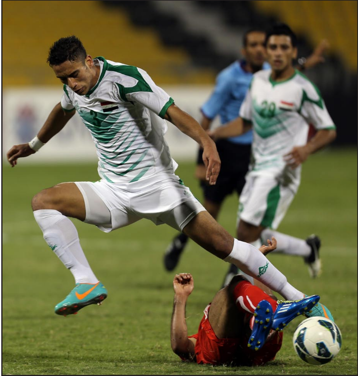
منتخبنا الوطني يعلن استعدادة لخوض غمار البطولة القارية