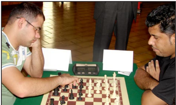
اريل تنظم بطولة الشطرنج

وأوضح : أن (نظام الكلاسك) يعني عدم السماح للاعب بارتداء البديلة الخاصة باللعبة وشد الأربطة لذلك يطلق عليها ب(الكلاسك). يذكر أن الاتحاد العربي للوقفة البدنية والملاوة ومقره لبنان لم يقيم أية بطولة منذ أكثر من عامين والمتفلس الحقيقي للوقفة البدنية العراقية هي المشاركات الآسيوية والعالية فقط بعكس كل الاتحادات المركزية الأخرى الالومبية وغير الالومبية منها.