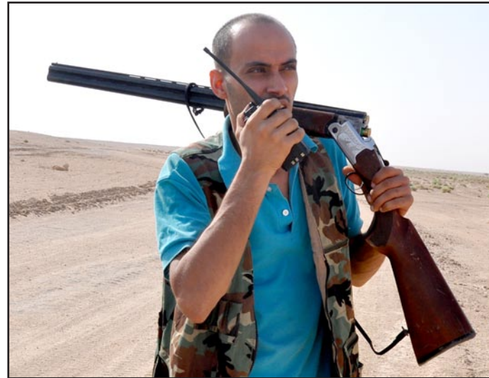
اتصالات من أجل الصيد

أيدي البطانة وهو في تضليل إني أراه كأنه في رقة ال شطنرج أو في قاعة التمثيل