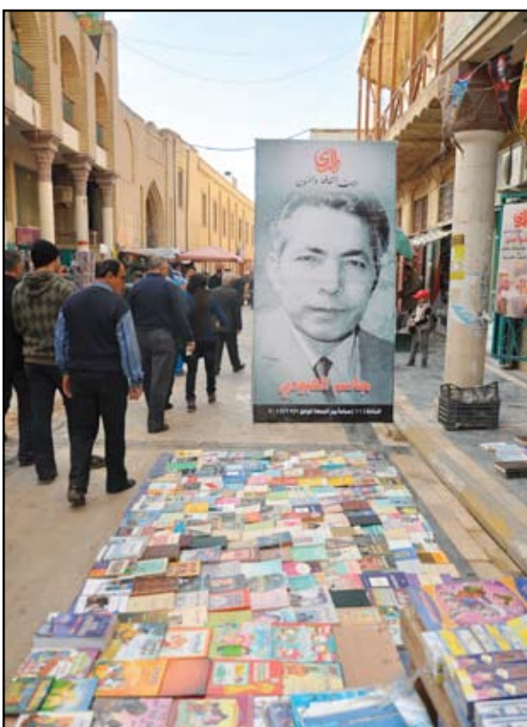
العبودي يتوسط شارع المتنبي

قرار رئيس الجمهورية بإقالة النائب العام. لكننا جمهورية المالكي حيث نجد من يصمت ويضع رأسه في الرمال وهو يرى كيف يهان موظف حكومي جريمته الوحيدة أنه رفض أن يتحول البنك المركزي إلى بيت للمال عند الخليفة.