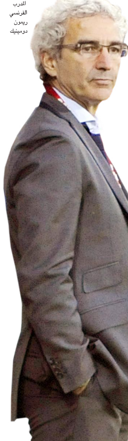
المدرّب الفرنسي ريمون دومينيك