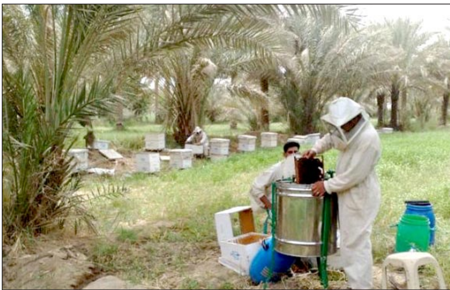
نخالون بانتظار قانون الحجر الزراعي... ألا من مجيب؟! (أرشيف)

أما الحنطة وحسب إحصائية وزارة التخطيط فإن المنتج المحلي يغطي ٦٠ . ٦٧٪ من الحاجة المحلية وهذا مشجع جداً، وليس بإمكان القطاع الخاص أن يستورد حنطة مخزنها بصوامع التجارة مثل المنتج المحلي الذي من المفروض أن يستوعب الحاجة التامة لأمن غذائي . وليس بإمكان التجارة ومن تجربتها العريقة دعم الرغيف؛ ودعم سعر الحنطة المحلية؛ وهكذا الرز أو على الأقل فتح مجال استيراد بنسبة ربع المستورد كتجربة إيجابية حسن نية مختلف لحدودية الإنتاج المحلي (سكر العمارة وبنجر الموصل) لا بد من جعله مواكباً لأي محصول إستراتيجي . ليس ذلك ممكناً؟