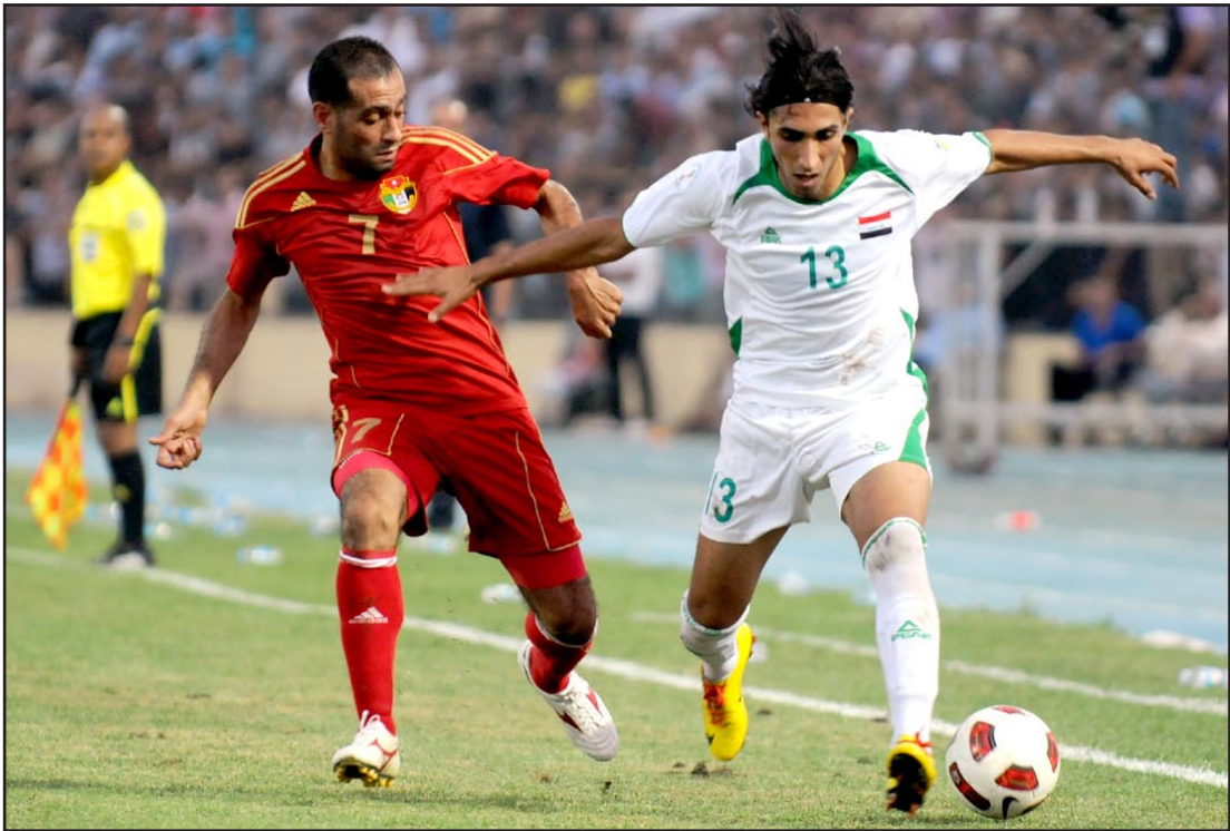
منتخبنا يواجه الاردن في ظل غياب ابرز اللاعبين

الظروف القاسية التي واجهت منتخبنا من خلال التغييرات المتكررة التي عمد لها البرازيلي زيكو وعدم استقراره على تشكيلة ثابتة لكن ومع ذلك تبدو حظوظ منتخبنا كبيرة من خلال ما شاهدناه من اندفاع خلال المباراتين الاخيرتين امام الاردن وودية البحرين.