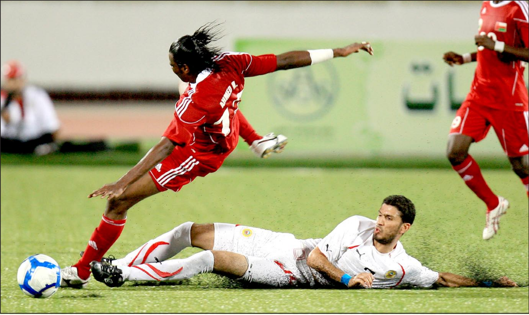
عُمان في مواجهة ساخنة مع لبنان

وستشهد البطولة مواجهات حامية الوطنية، خصوصاً في المجموعة الأولى حيث ستلوح للكويت فرصة الثأر من لبنان الذي أسهم في إخراجها من الدور الثالث لتصفيات آسيا المؤهلة الى مونديال ٢٠١٤ في البرازيل، ويبدو ان "الأزرق" و "رجال الأزرق" هما الأكثر